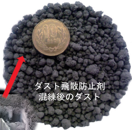
ダスト飛散防止剤 混練後のダスト